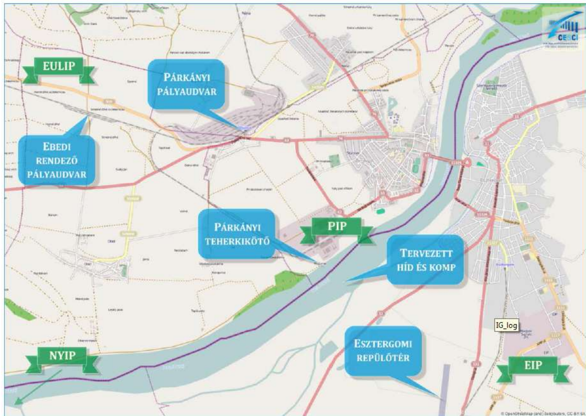
2.ábra: Logisztikai Övezet, forrás: Vállalkozási - Logisztikai Övezet, Határon átnyúló integrált területi beruházás, Ex-ante értékelés, Ister-Granum

Az előző programozási ciklusban a turizmussal kapcsolatos projektek lettek többségben támogatva, a jövőben emberi erőforrás áramlás, határon átnyúló munkavállalás, egészségügy lesznek a fő irányok.