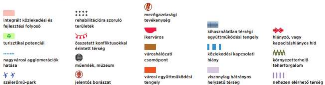
1. ábra: Komárom-Esztergom megye érték-és konfliktustérképe, forrás: megyei koncepció, Város-Teampannon